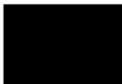
Jet Black uni