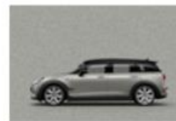
Melting Silver metallic