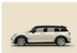
Pepper White uni