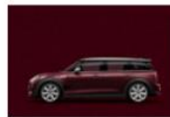
Pure Burgundy metallic