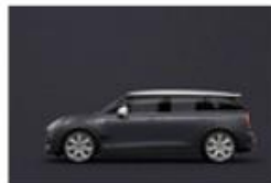
Thunder Grey metallic