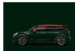
Rebel Green uni