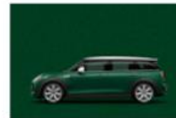
British Racing Green metallic