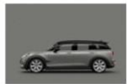
Moonwalk Grey metallic