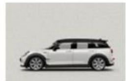
White Silver metallic