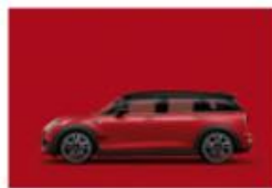
Chili Red uni