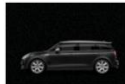
Midnight Black metallic