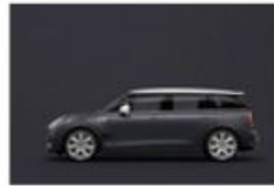
Thunder Grey metallic