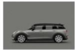
Moonwalk Grey metallic