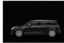
Midnight Black metallic