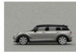
Melting Silver metallic