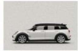
White Silver metallic