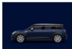
MINI Yours Lapisluxury Blue uni