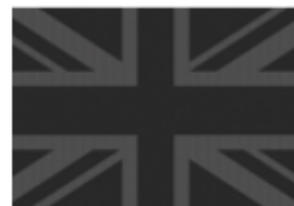
Softtop MINI Yours (3YR)